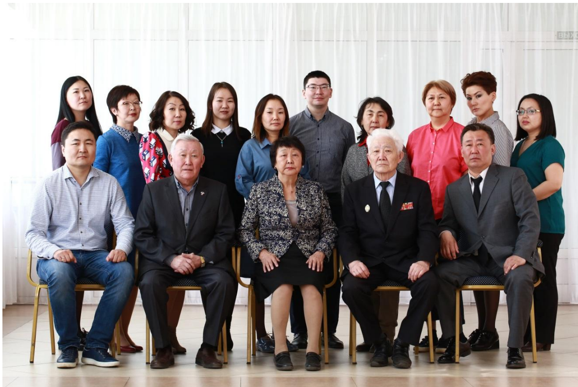
Преподаватели и сотрудники кафедры, 2017 г.

Также на кафедре осуществляется подготовка научных кадров высшей квалификации в аспирантуре по специальности 5.2.3. « Региональная и отраслевая экономика ». Программа нацелена на формирование исследователей и преподавателей, способных решать актуальные задачи развития региональной экономики и вносить вклад в научное сообщество.