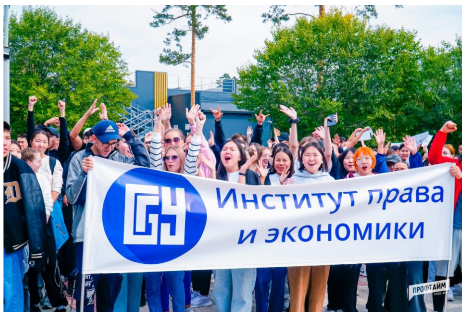
На стадионе Бурятского государственного университета