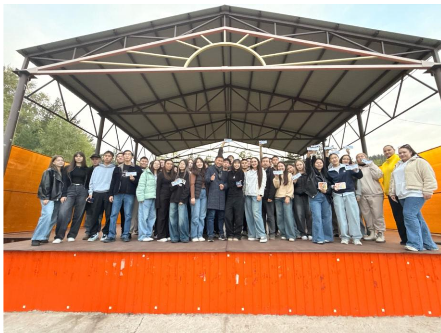
Первокурсники института права и экономики, 2025 год