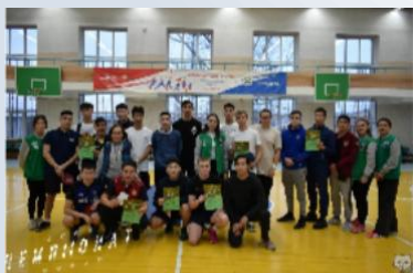
Сборная БГУ по настольному теннису