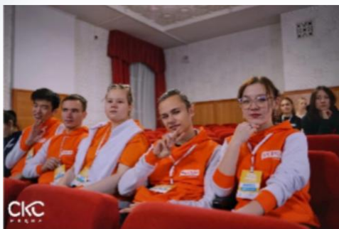
Первичная профсоюзная организация студентов