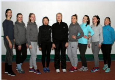
Сборная БГУ по легкой атлетике