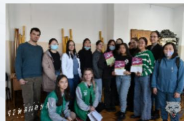
Сборная БГУ по шахматам