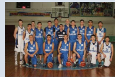
Мужская сборная БГУ по баскетболу