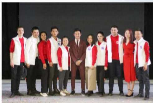
Федерация студенческого самоуправления