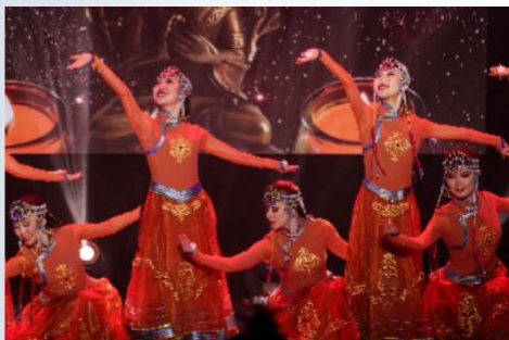
Народный студенческий ансамбль песни и танца «Байкальские волны»