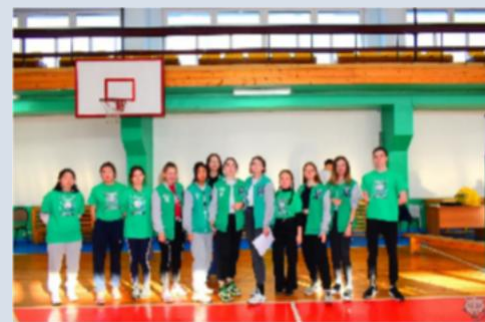
Студенческий спортивный клуб «Байкальские волки»