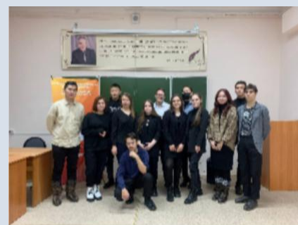
Патриотический клуб «Я горжусь»