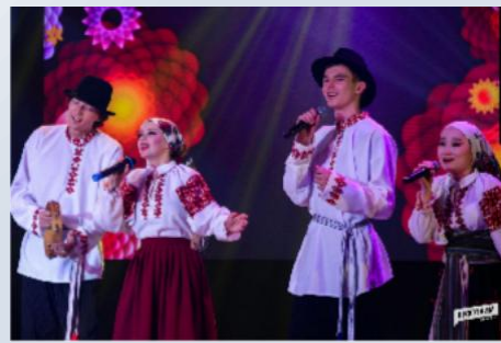
Студенческий ансамбль песни и танца «Байкальские самоцветы»