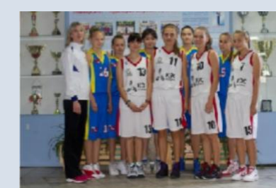
Женская сборная БГУ по баскетболу