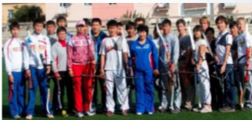
Сборная БГУ по стрельбе из лука