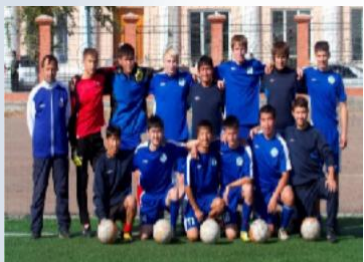
Мужская сборная БГУ по футболу