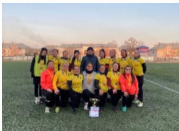
Женская сборная БГУ по футболу