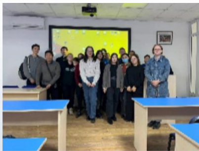
Студенческое научное общество