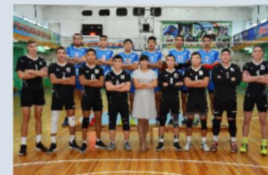
Мужская сборная БГУ по волейболу