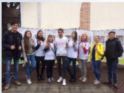
Региональная общественная организация «Милосердие»