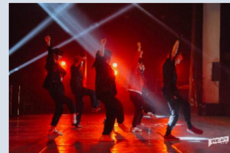
Студии современного танца «Project A2»