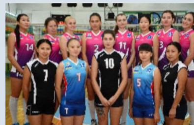
Женская сборная БГУ по волейболу