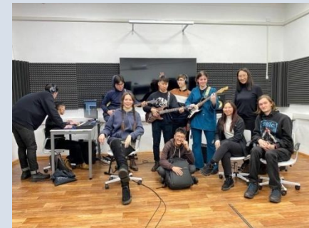
Творческая лаборатория «Event Sounds»