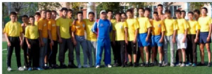
Сборная БГУ по вольной борьбе