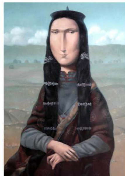
Картина Зорикто Доржиева «Джоконда Хатан» помещена на обложку книги «Сагаалган. Смысл традиций».

После проведения ритуала поздравления «Золгохо» все родственники и гости садятся за праздничный стол, угощают друг друга теми традиционными блюдами, которые готовят накануне, т.е. в «Бутуу удэр» (день, который завершает старый год). Традиционно у кочевых монгольских народов застолье продолжается недолго, поскольку необходимо обойти и поздравить всех старших родственников. Поэтому считается неприличным сидеть долго только у одних родственников. Перед уходом родственников и гостей хозяева дома обязательно дарят каждому подарок, так называемый «Сагаан сарын бэлэг» («Подарок на Белый месяц»). Близким родственникам,