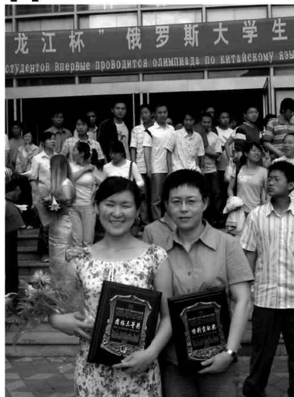
Студенты восточного факультета БГУ не первый год успешно участвуют в олимпиадах по китайскому языку