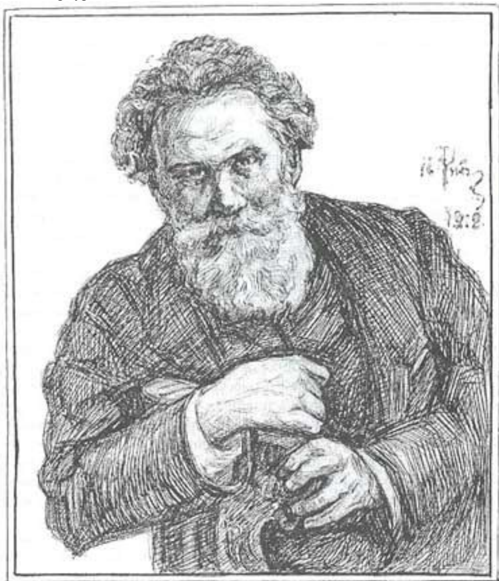
Портрет В. Г. Короленко. 1912 г.

даже в ущерб художественному замыслу. Наверное поэтому беллетристика «Русского богатства» была традиционно серой, вызвала многочисленные критические оценки, но для журнала она первостепенной роли не играла. Редактировал отдел беллетристики В.Г. Короленко. Он много писал сам для «Русского богатства», здесь опубликовал знаменитую «Историю моего современника», широко известные публицистические работы: «О свободе печати», «Сорочинская трагедия», «К полтавской трагедии». Менее известен отклик В.Г. Короленко на события Кровавого воскресенья. Как упоминалось выше, было запрещено что-либо публиковать по этому поводу. Статья Короленко напечатана через две недели после событий. Он писал: «Бывают дни и бывают события, в которых, как в фокусе, сосредотачивается значение самых глубоких сторон данной исторической минуты. Таково, по нашему глубокому убеждению, значение январских событий в Петербурге» 3 .