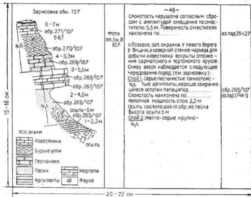
Рис. 1. Общий вид записей в полевом книжке

На рис. 1 приведен образец записей в полевой книжке. На полях, очерчиваемых на левой странице книжки, ставится номер точки наблюдения. Справа в колонке для записей указывается подробный адрес точки, а затем следует описание. На правых полях этих страниц указываются: номера образцов, замеры элементов залегания жил, разрывов и т. д. Для того чтобы определять назначение замеров, их следует подчеркивать особыми знаками, например; замер элементов залегания - чертой сверху и снизу, замеры жил — волнистой чертой, замеры разрывов - пунктиром и т. д. Замеры трещин необходимо сразу же выписывать на одну из левых страниц, в специально разграфленную для этого таблицу. На левых полях следует делать пометки о сфотографированных объектах, пометить особо важные образцы с окаменелостями, рудными и иными минералами.