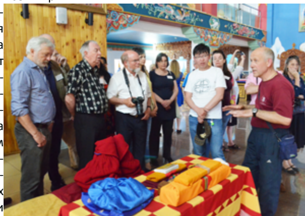
На экскурсии в дацане «Ринпоче Багша».

Следующее заседание Совета состоится в рамках первого Конгресса Университета Арктики и пройдет в Санкт-Петербурге в сентябре 2016 года, когда Совет, Форум ректоров и встреча представителей тематических сетей состоятся в одном месте.