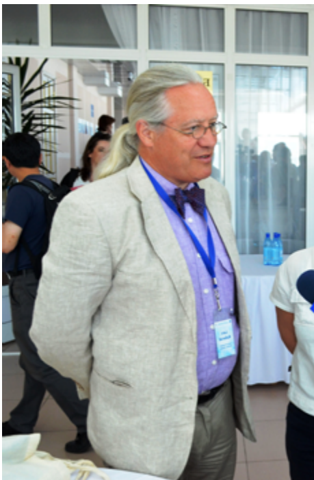
ЛАРС КУЛЛЕРУД, ПРЕЗИДЕНТ УНИВЕРСИТЕТА АРКТИКИ:

— Впечатления от форума самые позитивные. Достаточно посмотреть вокруг — на счастливые, улыбающиеся лица. Абсолютно точно можно сказать, что мы достигли целей, которые поставили, потому что мы встретились и общаемся с людьми из разных стран, городов и университетов. Вторая цель была — показать всем людям арктического региона, что такое Бурятия, чтобы они