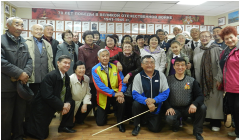
В музее Славы улуса Галтай.

нии к старшему поколению – живым и павшим. Наверное, не случайно присущее галтайцам внутреннее благородство, «горение», а не равнодушие заложено и в самом названии улуса. Ведь