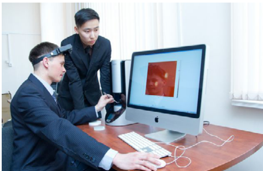
Молодые учёные работают с современным зондовым микроскопом.

Вообще для специальности «физика» в аспирантуре университета есть несколько направлений. Одно из них, старейшее, посвящено природе перехода между жидкой или твердой и стекловидной фазами. Кроме того, данное направление изучает вопрос о том, какие физические процессы приводят к основным свойствам стекла. Эти работы из области фундаментальных проблем