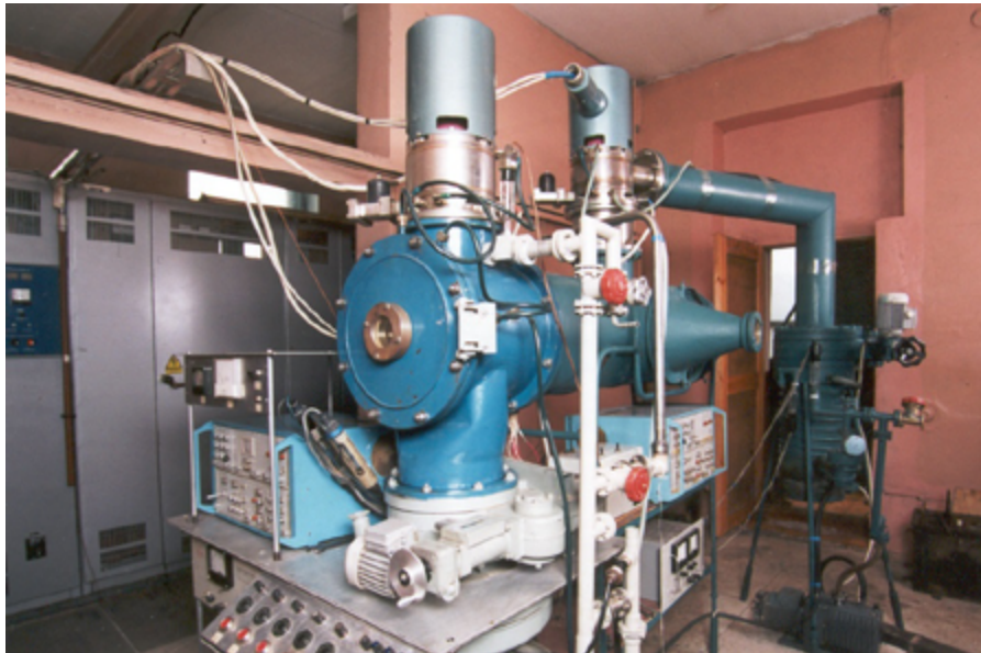
Вот так может выглядеть рабочее место физика

теми, являлась вехой на пути большинства карьеристов. Сегодня ученая степень не является на рынке труда такой же универсальной ценностью, как, например, диплом элитарного вуза. Кстати, в Великобритании научная степень способна запросто закрыть ее обладателю дорогу в бизнес: считается, что у успешного в науке человека нет достаточного практицизма для того, чтобы стать эффективным менеджером. Однако степень часто может сократить путь в политику и в руководящие должности, да и в некоторых направлениях бизнеса все же соответствующая специальность