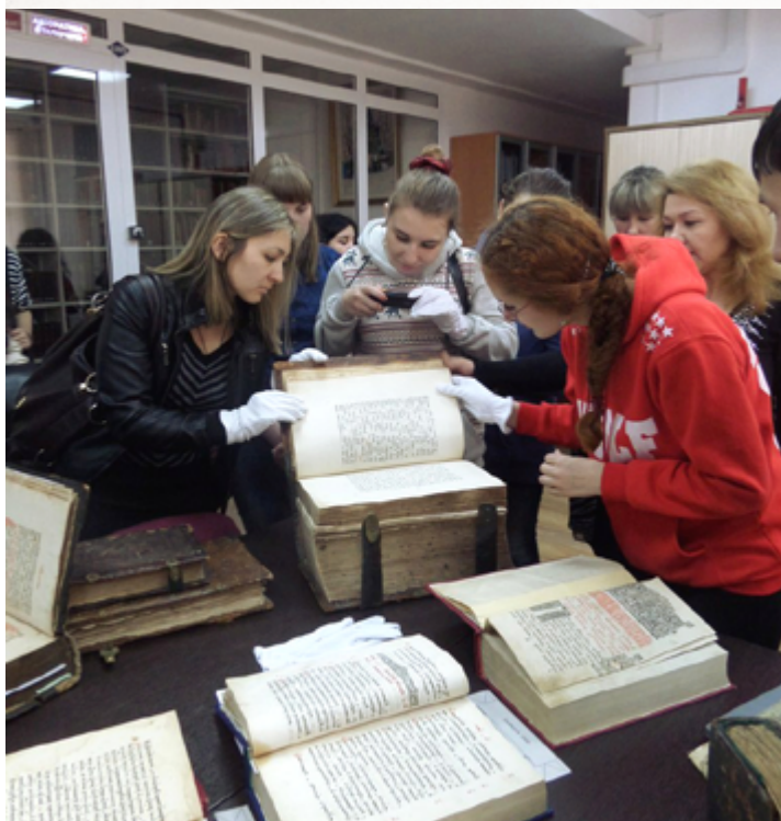
Студенты знакомятся со старообрядческими книжными памятниками в отделе редких и особо ценных изданий Научной библиотеки.

Информацию по предстоящим мероприятиям вы можете найти на сайте http://starobr.bsu.ru/ , связаться с оргкомитетом конференции можно по e-mail: starover_buryatia@mail.ru