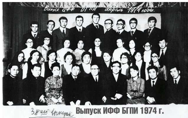
Выпуск ИФФ БГПИ 1974 г.

Поздравляю своих коллег, выпускников, студентов со славным юбилеем – 80-летием образования факультета. Желаю всем удачи, процветания, здоровья, бодрости, энергии, тепла.