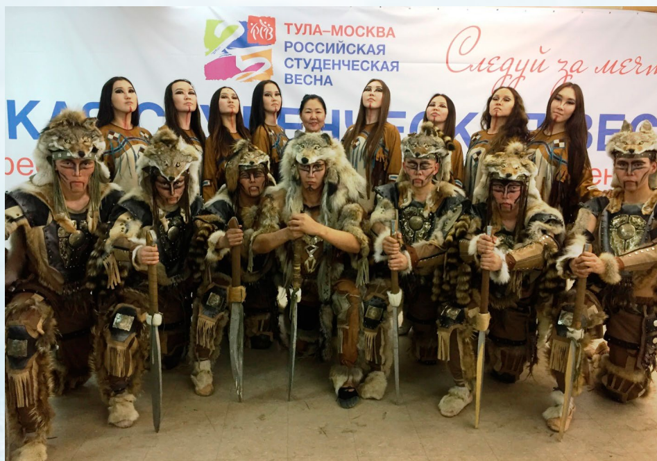
Байкальские волны» участвовали в гала-концерте «Российской студенческой весны»

лучших медиков приглашают работать в Иркутскую область, хотя мы знаем, что у них самих есть база для подготовки врачей.