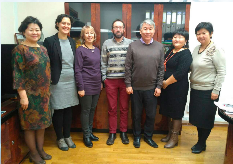
Французские партнеры в БГУ.

Французский язык также прочно укоренился в мире современных технологий. В январе 2017 г., во время последнего Салона в Лас-Вегасе (международный салон инновационных технологий в электронике - от переводчи. ) Франция была второй после США страной, предложившей фундаментальные проекты в области технических и цифровых инноваций. Несомненно, существует и Frenchtech , и несмотря на этот англицизм, французский язык завоевывает себе место в мире, где доминирует английский. Будучи языком инноваций, французский остается им и в литературной, и интеллектуальной областях: он меняет правила, рассматривает новаторские темы о гражданском обществе и устойчивом непрерывном развитии,