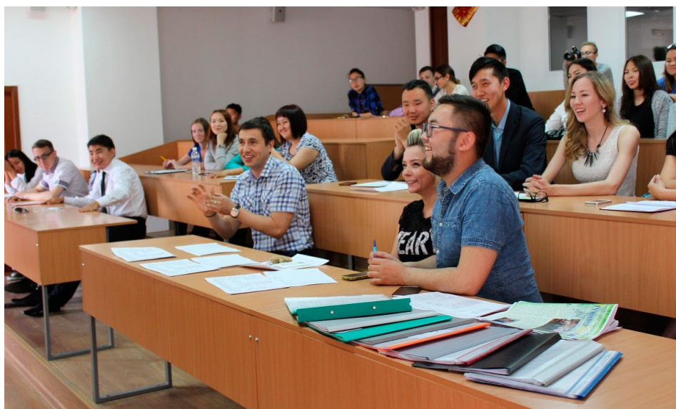
Конкурс на лучшую организацию студенческого самоуправления БГУ.