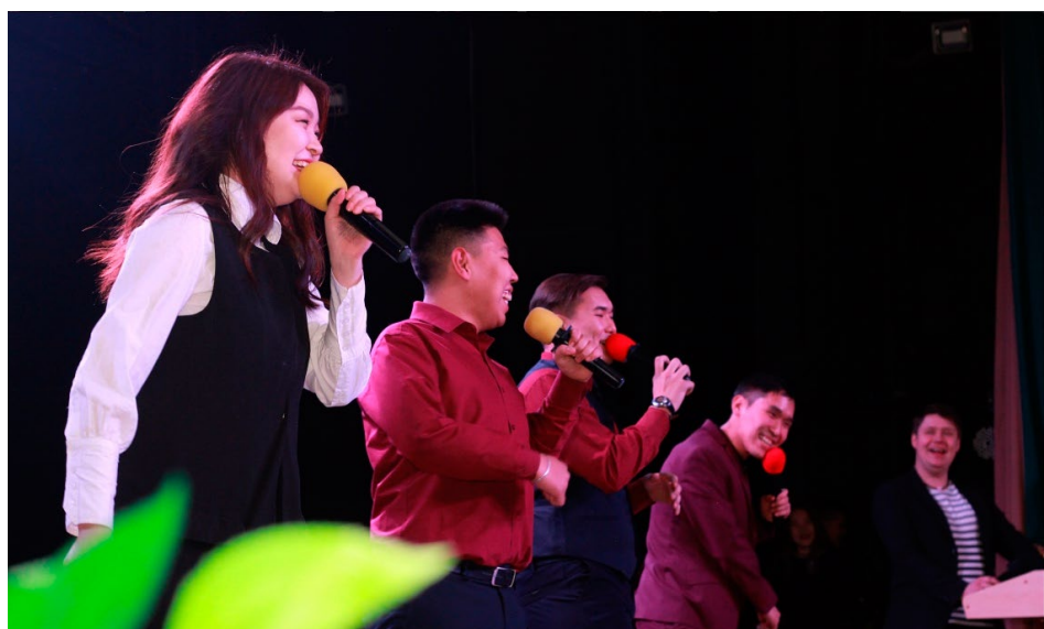
КВНщики на Открытом кубке БГУ.