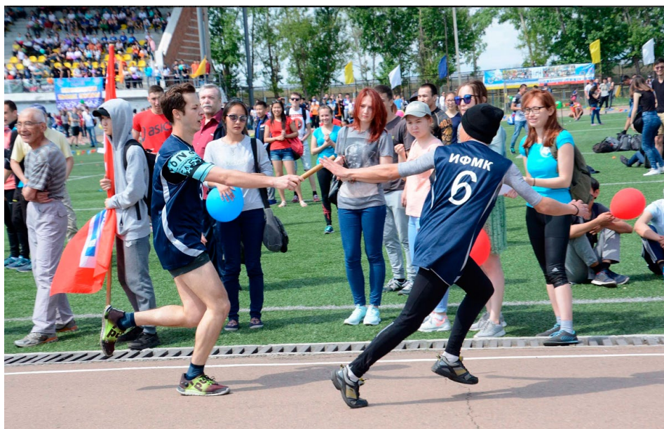
Соревнования на традиционном университетском празднике «День Здоровья».