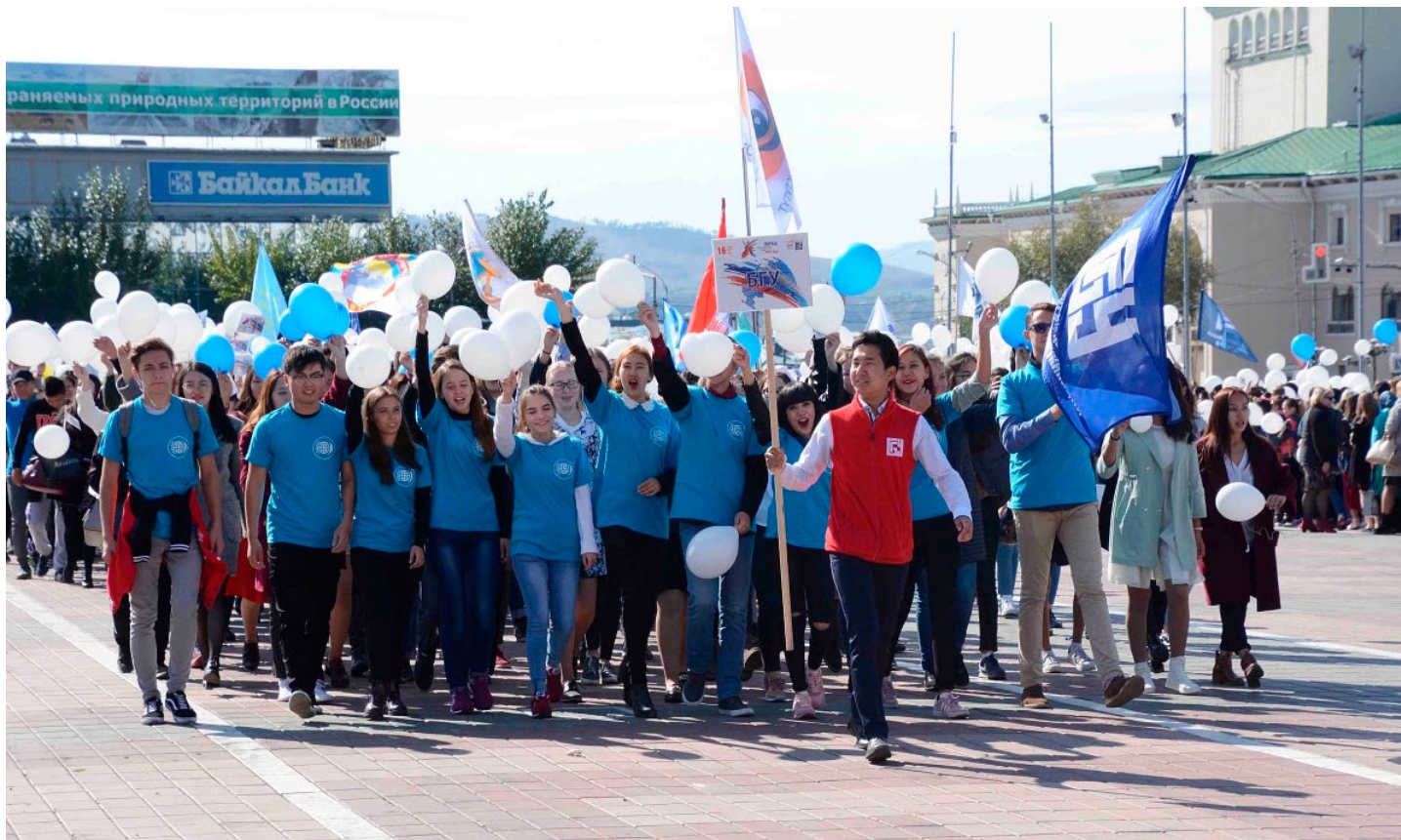
Первокурсники БГУ на параде студенчества.

Учебное заведение, в котором учится человек, играет огромную роль в его судьбе. Ежегодно в БГУ поступает огромное количество молодых людей. И мы решили спросить у студентов нашего университета, почему они выбрали именно БГУ, а не другой вуз.