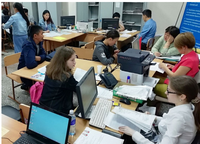
Работа приёмной комиссии в разгаре

Приёмная кампания — 2018 в БГУ почти завершена и успешно.