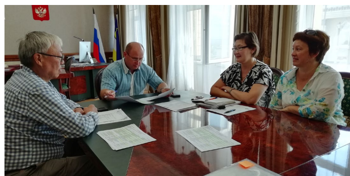
Подписание приказа о зачислении

Информация предоставлена Управлением довузовской подготовки.