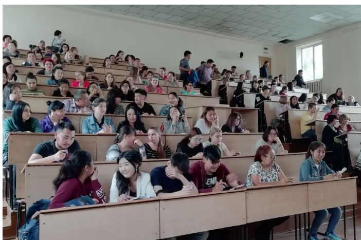
Консультация для абитуриентов