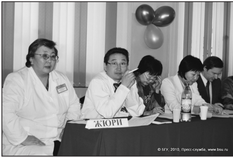
На медицинском факультете в марте прошла первая олимпиада по латинскому языку.