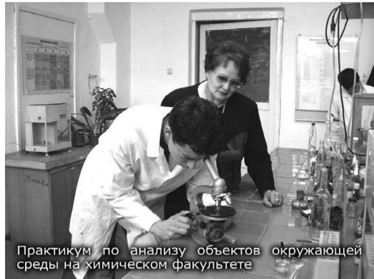
Практикум по анализу объектов окружающей среды на химическом факультете