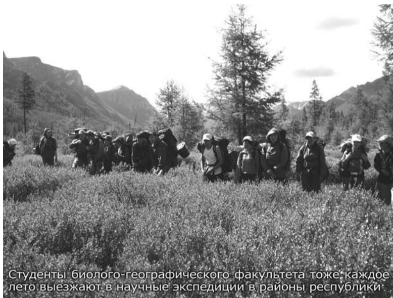
Студенты биолого-географического факультета тоже каждое лето выезжают в научные экспедиции в районы республики