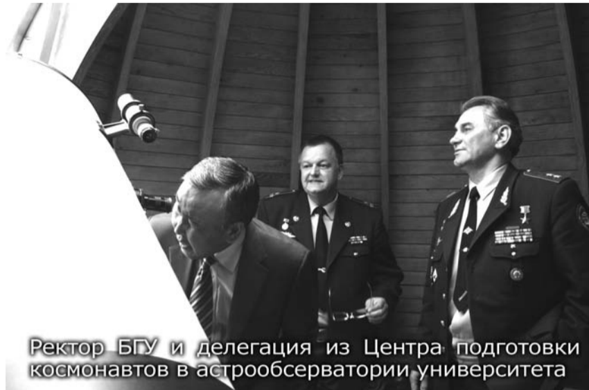
Ректор БГУ и делегация из Центра подготовки космонавтов в астрообсерватории университета

– Как уже сообщалось, делегация из Звездного городка во главе с начальником Центра подготовки космонавтов, к.т.н. В.В. Цыблиевым приезжала в Бурятию обсудить создание на Байкале реабилитационного медицинского центра космонавтов с применением восточной медицины, а также