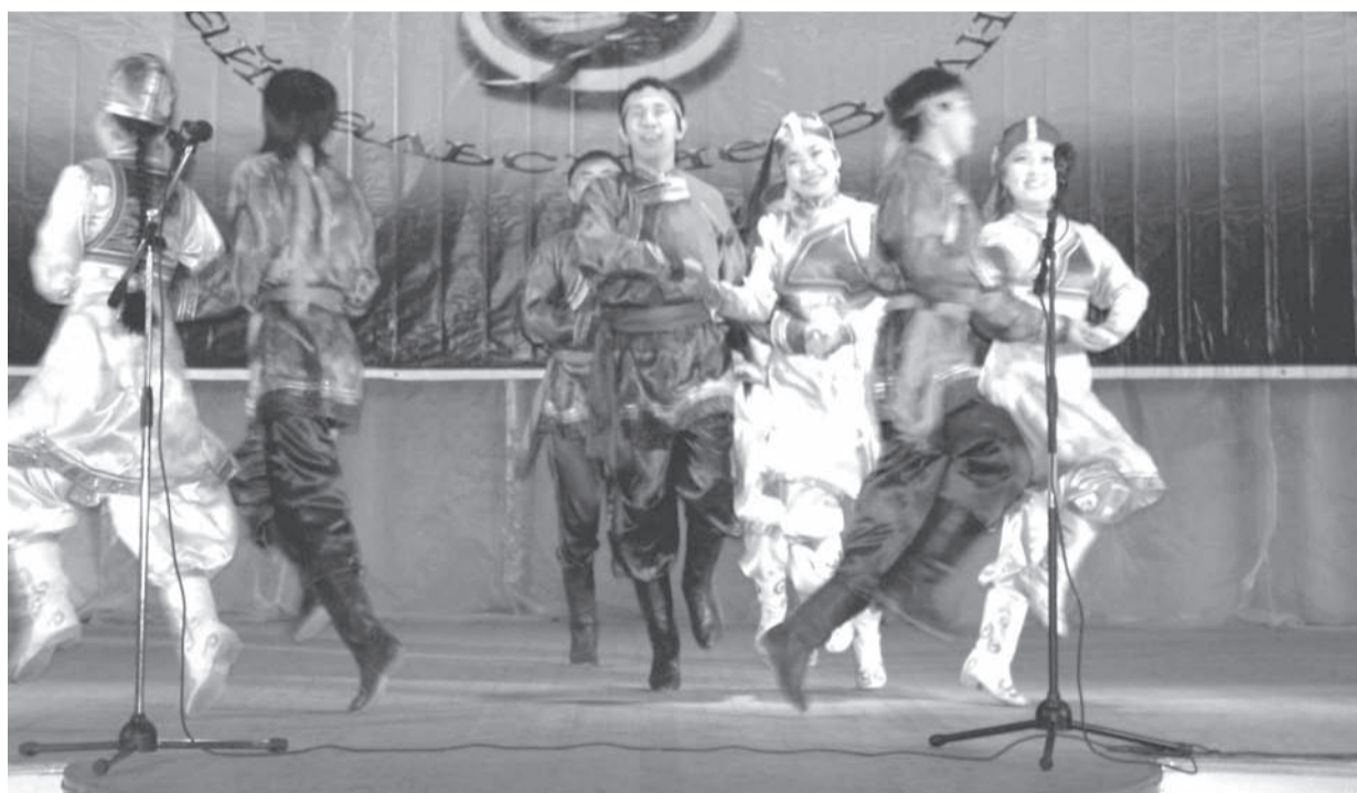
«Бурятский танец» в исполнении ансамбля «Байкальские волны»