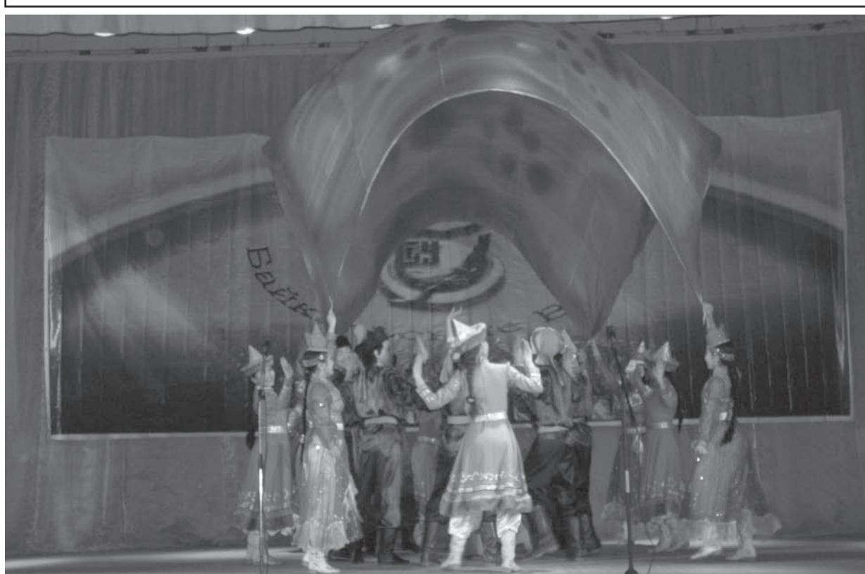
«Цветок Байкала» в исполнении ансамбля «Байкальские волны»