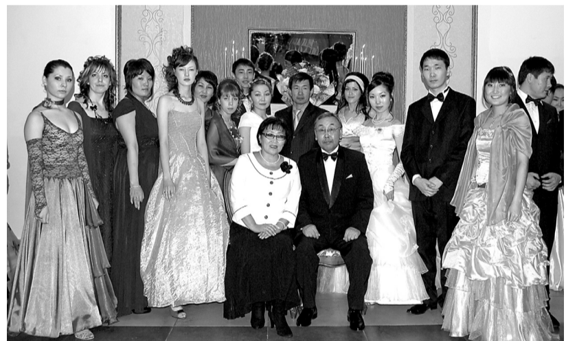
Студенты педагогического института на «Ректорском балу» - 2011

• Выпускники магистратуры могут стать преподавателями педагогики и специальных педагогических дисциплин в педагогических колледжах, училищах, вузах; исследователями проблем высшего образования в научно-исследовательских