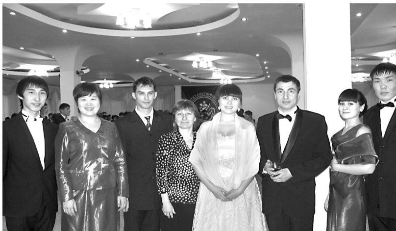
Колледж университета - участник «Ректорского бала»

В российском обществе до сих пор бытует мнение, что колледж - это не тот уровень образования, не те знания, умения и навыки, которые нужны современному человеку для успешного существования. За границей колледжи входят в состав университетов и молодые люди, окончившие его могут говорить, что учились в университете, где и получили прекрасное образование, дающие им больше шансов на успех в жизни.