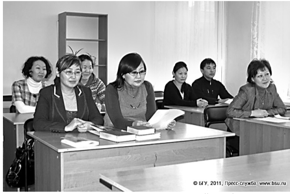
Преподаватели НГИ на университетской конференции

ском языке и так далее. Журналистика в НГИ – дело не новое. Начиная с 1991 года