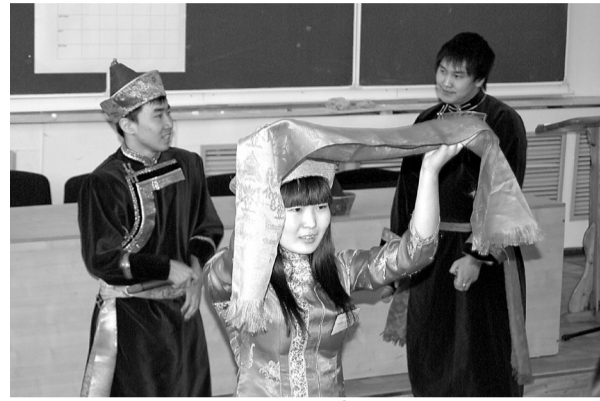
Межвузовская олимпиада по бурятскому языку в БГУ

ском языке и так далее. Журналистика в НГИ – дело не новое. Начиная с 1991 года