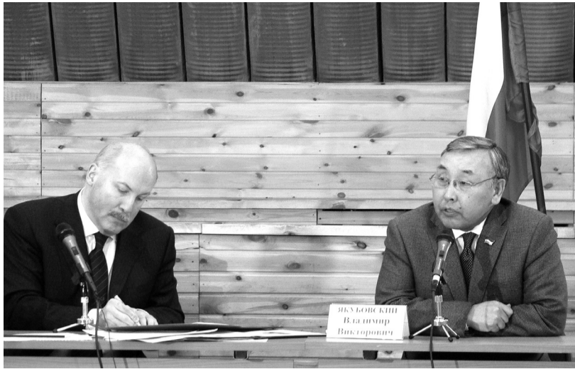
(Начало на стр. 1)