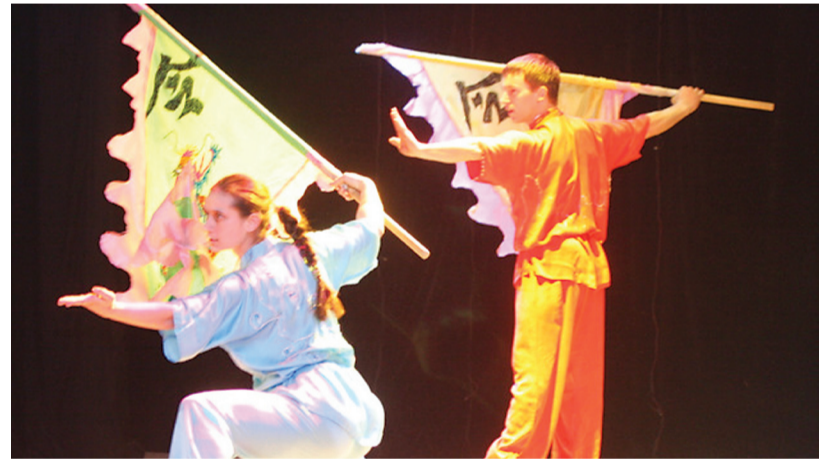
Выступление ушу в исполнении студентов ФФСит