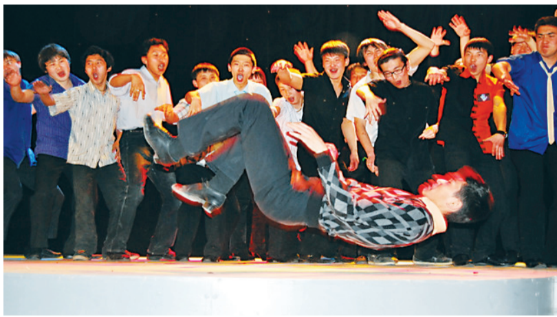
Сборная команда КВН-БГУ