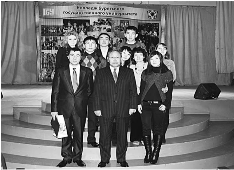
Директор Колледжа и ректор БГУ с лучшими студентами Колледжа.

«Колледж БГУ дает учащимся среднее профессиональное образование по шести аккредитованным специальностям. Колледж – полноценное структурное подразделение Университета,