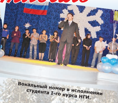
Вокальный номер в исполнении студента I-го курса НГИ.