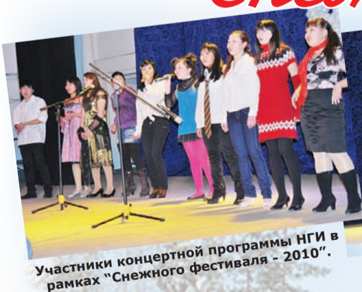
Участники концертной программы НГИ в рамках “Снежного фестиваля - 2010”.