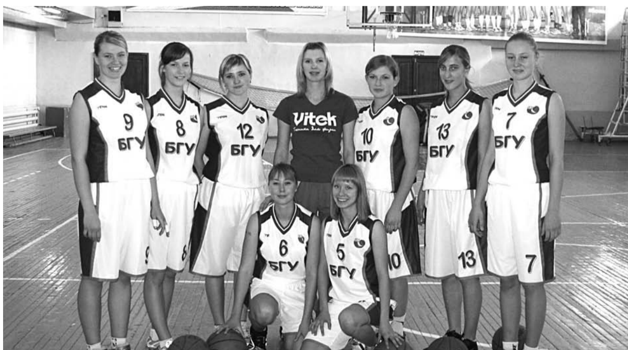
Женская сборная БГУ по баскетболу.