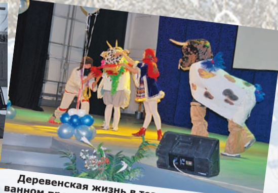
Деревенская жизнь в театрализованном представлении студентов ФФ.

Студенческая газета БГУ. Учредитель и издатель: Бурятский государственный университет. Адрес редакции: 670000, г. Улан-Удэ, ул. Ранжурова, 5. Телефон: (3012)21-95-49. E-mail: redaktorBSU@gmail.com. Редакция: Светлана Сибиданова, Феликс Хаптаев. Дизайн-верстка: Издательство БГУ. Отпечатано в типографии «Нова-Принт», г. Улан-Удэ, ул. Ранжурова, 1, тел. 21-25-52. заказ № ____, тираж 999 экз.