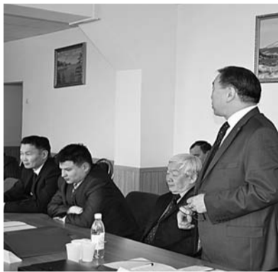
Заседание Совета директоров средних специальных учебных заведений.

В этот день состоялось заседание Совета директоров средних специальных учебных заведений, посвященное юбилею Колледжа, а в актовом зале БГУ прошло торжественное собрание выпускников, преподавателей, студентов и гостей – друзей Колледжа, с которыми он работает в течение всего периода своего существования, а также чествование лучших преподавателей, внесших весомый вклад в становление и развитие Колледжа БГУ.