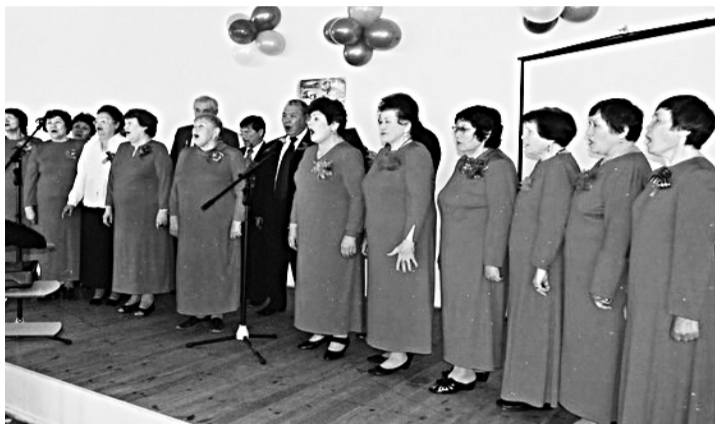
Выступление хора ветеранов на праздновании Дня Победы.

Выступления хора ветеранов также принесли много побед, среди которых особенно заслуженным и почетным стало третье призовое место в номинации «Академическое исполнительство» на Хоровой ассамблее, проводившейся в масштабах республики.