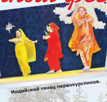
Индийский танец первокурсников.