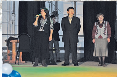
Жюри делится впечатлениями от концертной программы факультета.