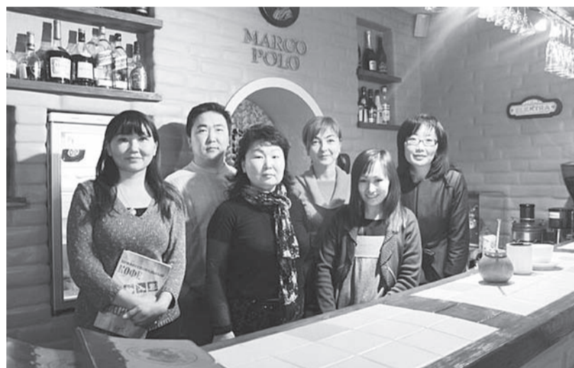
Курсанты на практическом занятии.

Бурятский государственный университет объявляет конкурс на замещение вакантных должностей: