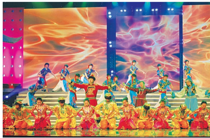
Выступление студентов БГУ на торжественном открытии форума Институтов Конфуция.

ных и по геополитическим факторам (интерес вызывает то, что мы – представители другой национальности буряты – находимся в России, многонациональность нашей республики, озеро Байкал, граничащая с нами Монголия), и по сегодняшнему уровню: Бурятский госуниверситет и Институт Конфуция БГУ хорошо развиваются. Сформировался очень хороший штат Института: хороший директор, заместитель, директор с китайской стороны, наши преподаватели (нужно отметить весь коллектив восточного факультета, который радеет за дело), 2 преподавателя – но-