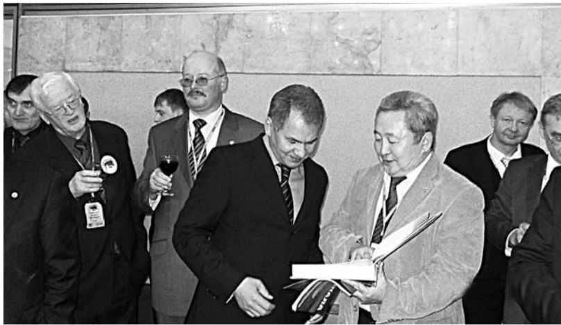
Член-корр. РАН А.К. Тулохонов вручает Президенту РГО С.К. Шойгу энциклопедию «Байкал: природа и люди».

В Москве 17-18 ноября в здании Президиума РАН прошел внеочередной съезд Русского географического общества (РГО), имеющий историческое значение как для географического сообщества, так и для всей общественности России.