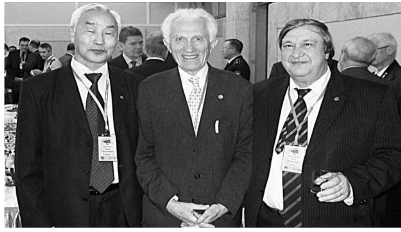
Д.г.н., профессор Б.Л. Раднаев, акад. РАН, почетный президент РГО, директор института географии Российской Академии В.М. Котляков; акад. РАН П.Я. Бакланов

Президент РГО С.К. Шойгу сказал: «Географическое общество было незаслуженно забыто властью, благотворительными структурами и россиянами в целом». Итак, власть осознала значение географии для общества, но само общество не осознает все это сразу и одновременно. Поэтому львиная доля в решении этих вопросов лежит на совести географов, которым предстоит воспитывать подрастающее поколение и прививать географическую культуру каждому гражданину нашей страны. Составными элементами географической культуры являются географическое образование на современной научной основе, любовь к окружающему миру, уважение к человеку, его труду и истории. Географическая культура прививается в