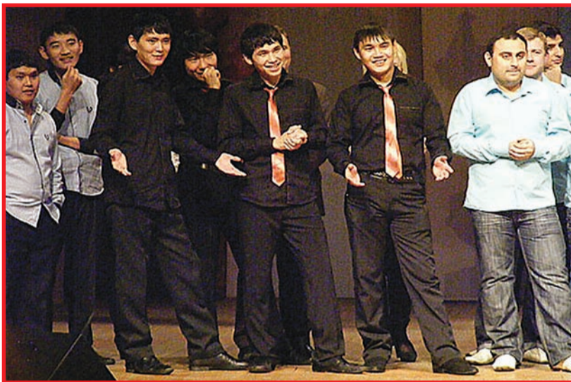
Первый полуфинал лиги Республики Бурятия.