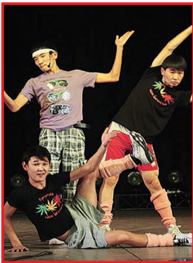
Финал байкальской лиги.