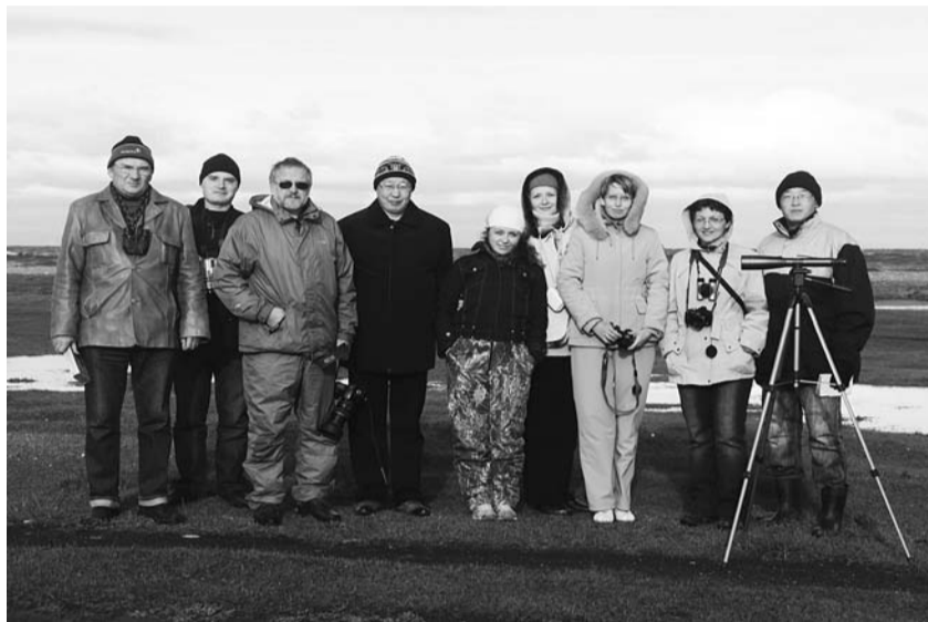
Участники конференции на экскурсионном выезде на Байкал.

польза птицам. А до этого нам ещё далеко. Поэтому ещё работать и работать».