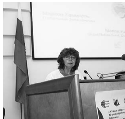
Конференция «Живые озера» предоставила возможность для обмена опытом между немецкими и российскими экспертами.