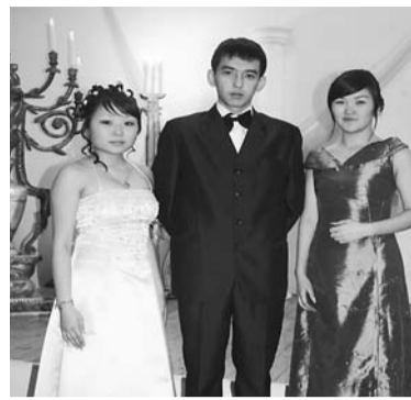
Лучшие студенты Колледжа на Ректорском балу.

Выигранные в 2008 г. гранты Комитета по социальной политике Администрации г. Улан-Удэ и Администрации Президента и Правительства РБ позволили провести ряд дискуссионных площадок по данному вопросу, научно-практическую конференцию и выпустить сборник научных работ по проблеме противодействия экстремизму.