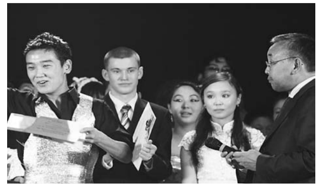
Награждение на фестивале «Первый снег».