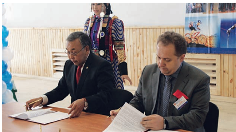
Подписание соглашения о сотрудничестве между БГУ и Министерством образования Иркутской области.

26 сентября в Бохане состоялось открытие нового учебно-спортивного комплекса Боханского филиала Бурятского государственного университета.