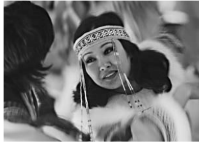
Танец «Пробуждение Севера».

– Мы знаем, что народный студенческий ансамбль «Байкальские волны» только что вернулся из Бохана, где прошло торжественное открытие учебно-спортивного комплекса Боханского филиала БГУ. Расскажите, пожалуйста, подробнее об участии ансамбля в этом событии.