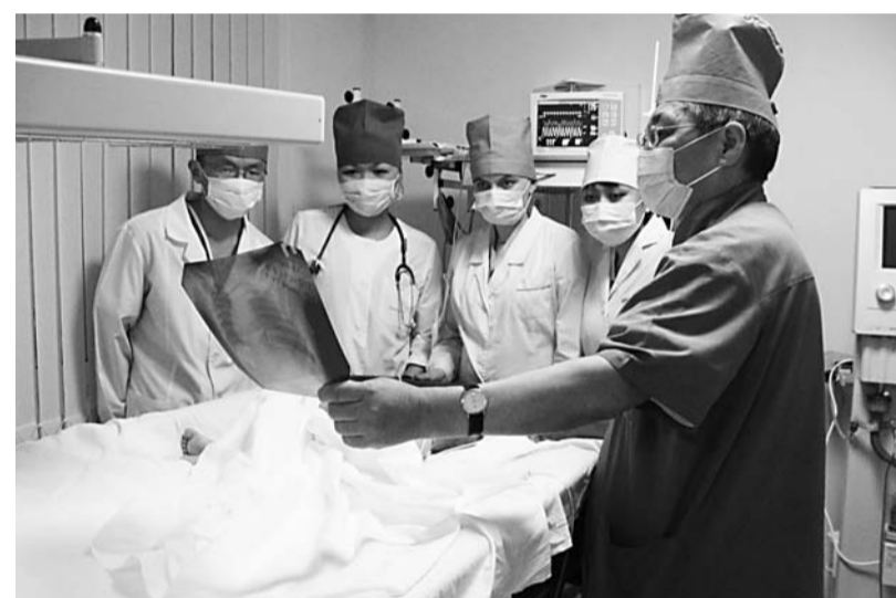
Занятие студентов МФ на одной из клинических баз.