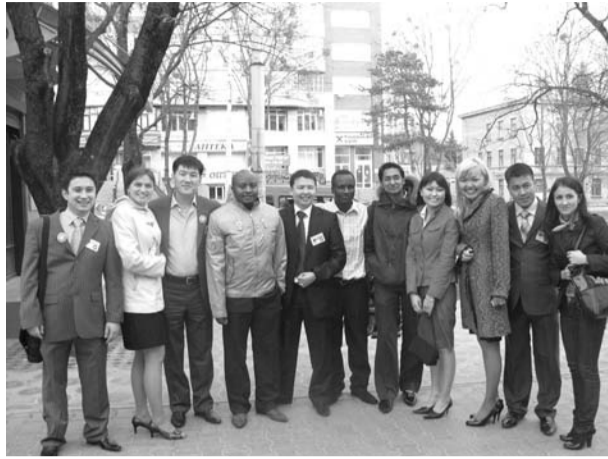
С участниками конференции.

Программа конференции была очень насыщенной. На экскурсии по Ставрополю мы познакомились с историческими памятниками культуры, парками, театрами. Посетили святой источник «татарка», которая обладает лечебными свойствами. Древний город представляет собой «Северные ворота Кавказа». Здесь отдыхали и проживали Пушкин, Грибоедов, Лермонтов, Суворов и другие известные личности.