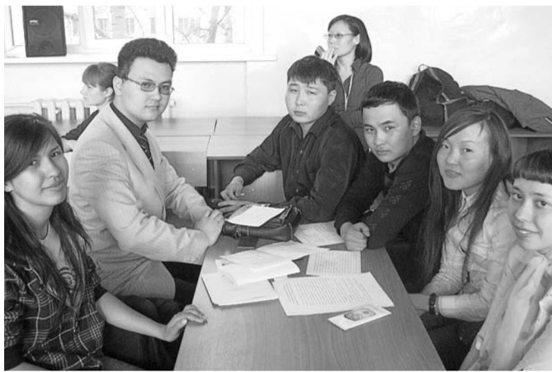
Команда ФЭУ «Перспектива».

В третий день состоялась переговорная площадка «Стратегия развития Республики Бурятия: