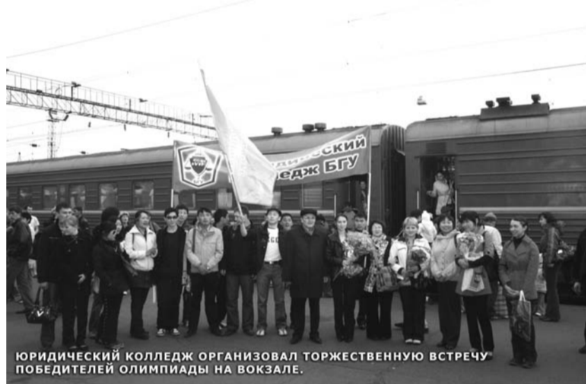
ЮРИДИЧЕСКИЙ КОЛЛЕДЖ ОРГАНИЗОВАЛ ТОРЖЕСТВЕННУЮ ВСТРЕЧУ ПОБЕДИТЕЛЕЙ ОЛИМПИАДЫ НА ВОКЗАЛЕ.

нием олимпиады, но и тем, что мне выпала хорошая возможность посмотреть на достопримечательности славного и великого города-героя Смоленска. Мы надеемся, что когда-нибудь в недалеком будущем мы сможем провести такую же олимпиаду у себя в «родных пенатах», то есть в Республике Бурятия».