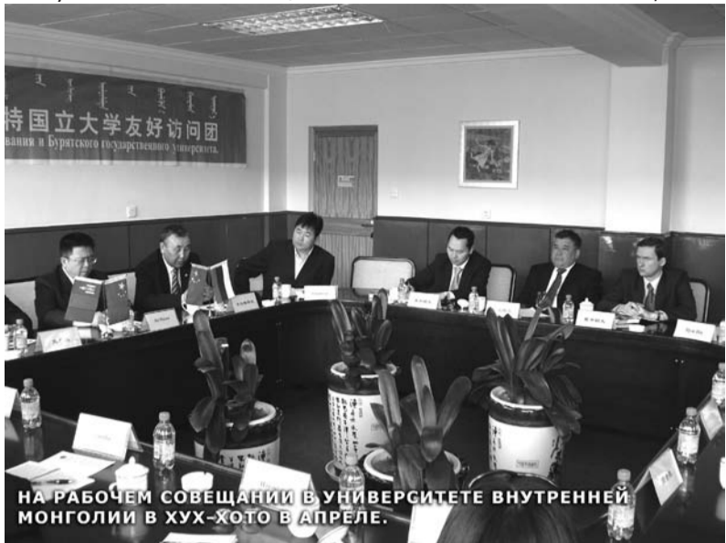
НА РАБОЧЕМ СОВЕЩАНИИ В УНИВЕРСИТЕТЕ ВНУТРЕННЕЙ МОНГОЛИИ В ХУХ-ХОТО В АПРЕЛЕ.