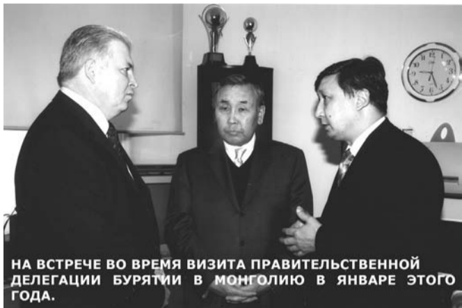
НА ВСТРЕЧЕ ВО ВРЕМЯ ВИЗИТА ПРАВИТЕЛЬСТВЕННОЙ ДЕЛЕГАЦИИ БУРЯТИИ В МОНГОЛИЮ В ЯНВАРЕ ЭТОГО ГОДА.

факультета БГУ. (В понимание традиционной включается тибетская, вос-