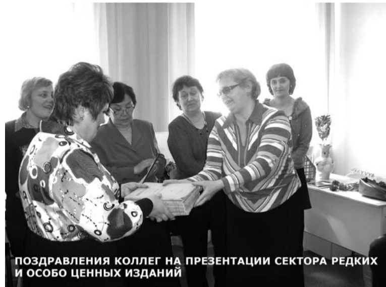
ПОЗДРАВЛЕНИЯ КОЛЛЕГ НА ПРЕЗЕНТАЦИИ СЕКТОРА РЕДКИХ И ОСОБО ЦЕННЫХ ИЗДАНИЙ

4 апреля в 1 корпусе БГУ Научная библиотека провела презентацию Сектора редких и особо ценных изданий. На презентацию были приглашены коллеги из Национальной библиотеки, Научной библиотеки ВСГТУ, музея БНЦ СО РАН, центра восточных рукописей ИМ-БИТ СО РАН.